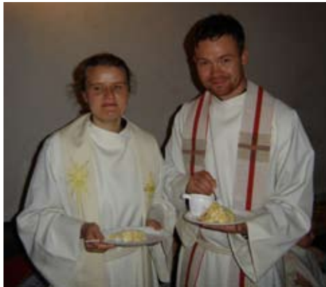
Det var ekstra god kake under kirkekaffen søndag den 6. november