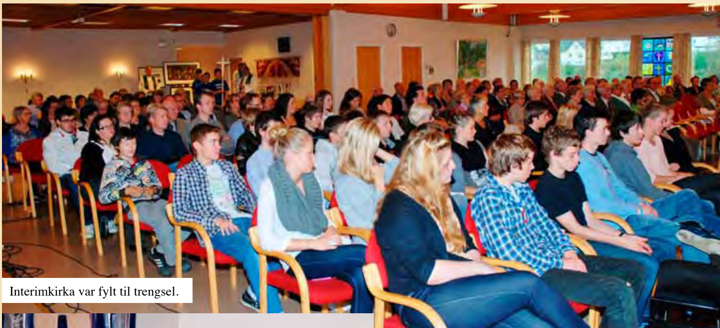
Interimkirka var fylt til trengsel.