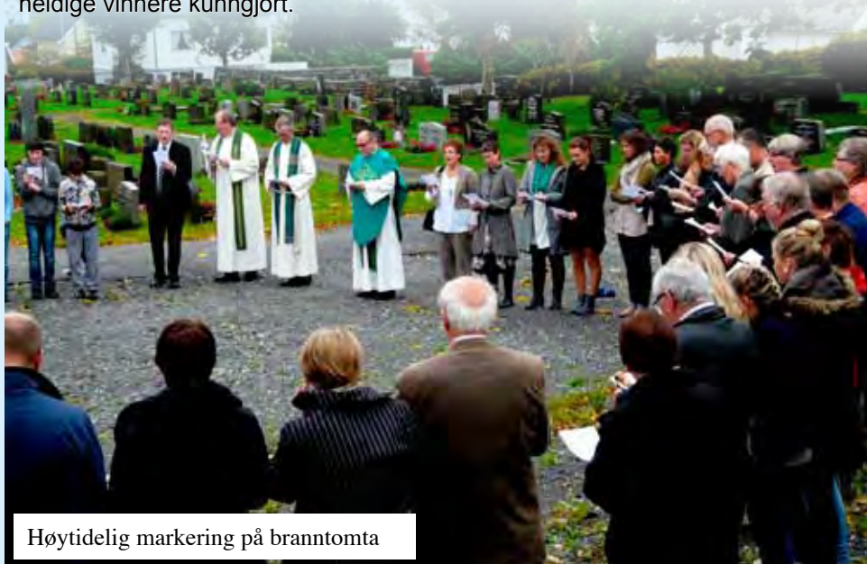
Høytidelig markering på branntomta