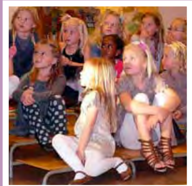
Silva sang på høstbasaren. Se s. 5