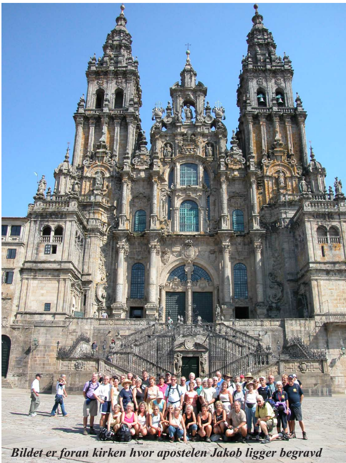
Bildet er foran kirken hvor apostelen Jakob ligger begravd

Bildene som følger er fra 47 stk som gikk pilegrimsveien til Santiago de Compostella i september. Nærmere 14 mils vandring. Hvert år går nå 150 000 mennesker veien til Santiago. Det er en vandring i Europas kulturhistorie. Med de fleste skjer det noe med når målet er nådd. Ingen kan forklare det. Det er bare sånn.