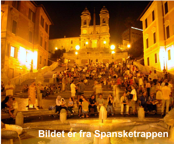
Bildet er fra Spansketrappen

av fransiskanerne, Frans av Assissi, og den koselige middelalderbyen Pienza.