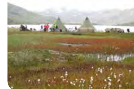
Leirslagning på fredag ved Nedre Grøndalsvatn, 978 m.o.h..