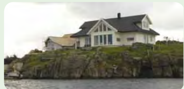
“Huset på holmen.”

De har bygget hus helt i sjøkanten, og nå venter de bare på å få opp naustet nede på brygga.