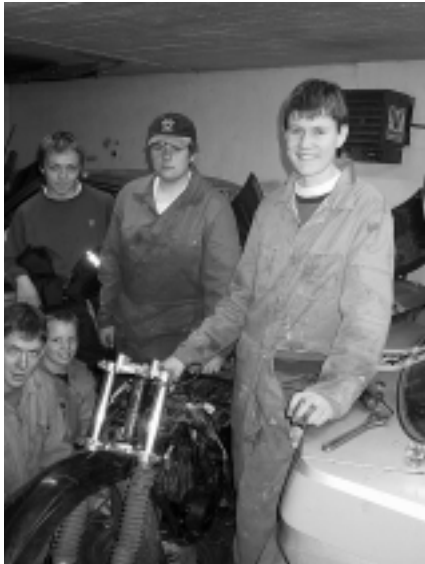
Akutt overhaling! Eieren av Suzuki TS kom seg ikke hjem på mopeden fra mekkekveld på Torvastad kulturhus. Manglende vedlikehold straffer seg...

ken, kan bekymrede foreldre med fine personbiler gjerne stille et spørsmålstegn ved.