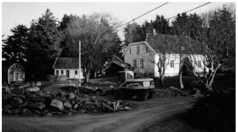
Bygging av steingard på Torvastad prestegård 2002