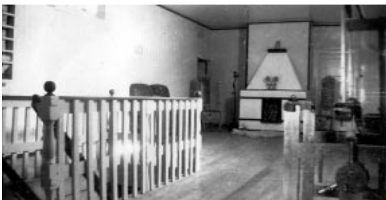
Løftet på Torvastad prestegård. De gamle dørinnfat- ningene kan skimtes til høyre.