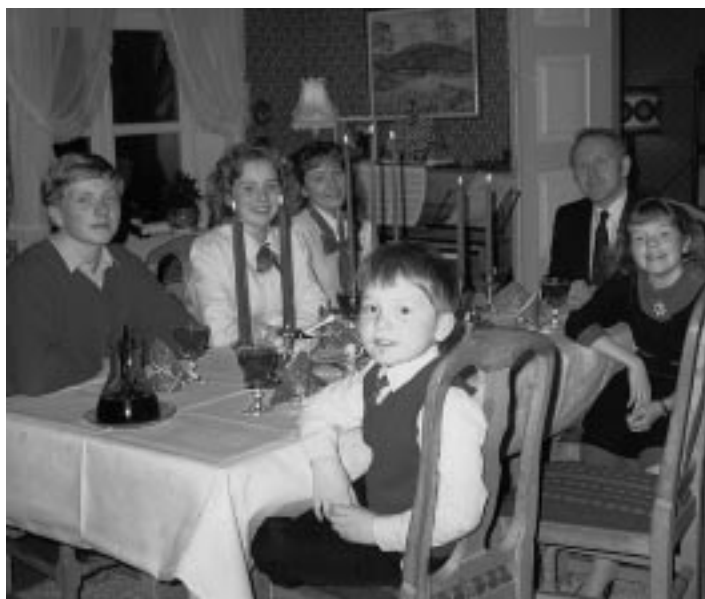
Familien Viste samlet rundt bordet i midtstuen julen 1985

Det første jeg tenkte på av minner var Misjonsforeningen sin basar i stuenene med mannscoret til stede. Vi ungene syntes det var fantastisk gøy. Ellers er jula i prestegården gode minner om høytid og glede. Det var stas når vi åpnet de store dørene til ”finstua” for å pynte til jul. Søndagene spiste vi alltid frokost i den midterste stua før vi gikk i kirka.