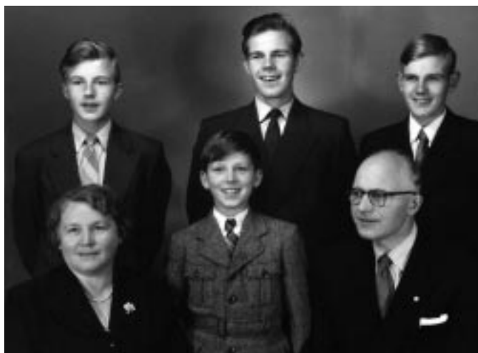
Familien Acklett, 1957.

lingssted for andre ulike aktiviteter. I første etasje var 4 store stuer etter hverandre. Disse stuenene har sikkert hatt ulike funksjoner under de forskjellige prestefamiliene, men hos oss hadde disse fire stuenene følgende funksjon: Soverom, dagligstue, spise-stue og storstue.