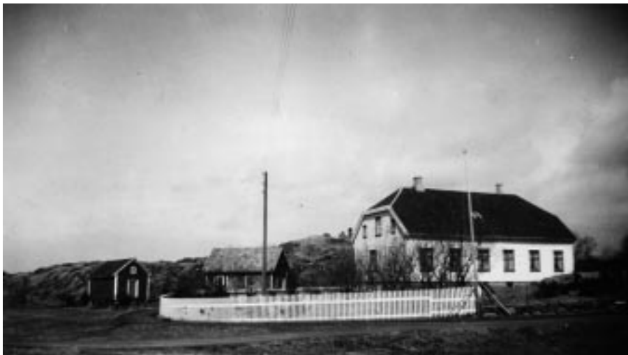
Torvastad prestegård ca.1950

finnes rester fra den gamle hovedbygningen. Her var det tømmeret som ble brukt. Noe av det eldste på den nåværende prestegården er stabburet. Alderen er ukjent, men både i 1708 og i 1798 omtales et stabbur. Noe av det vi legger merke til på bildet er hagen. Den er gjenskapt i Norsk Folkemuseum på Bygdøy foran hovedbygningen på Leikanger gamle prestegård.